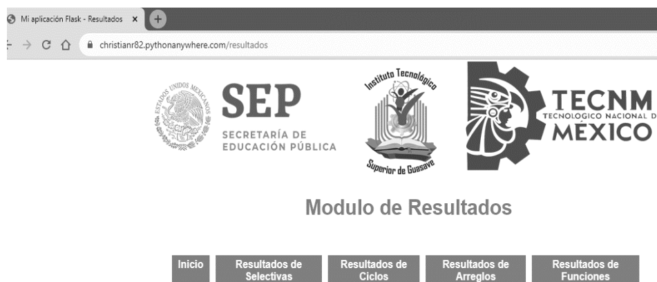
Figura 4. Módulo de resultados de las diferentes evaluaciones.

También, se logró diseñar y programar el módulo de resultados como parte medular del proyecto, como se observa en la Figura 4, donde se organizaron todos los diferentes módulos de las evaluaciones de los estudiantes.