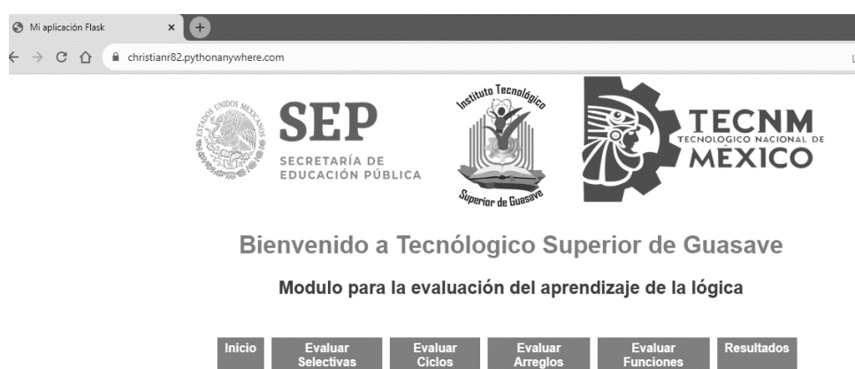
Figura 2. Página de inicio del módulo de evaluación del aprendizaje.

Se diseñó y desarrolló una herramienta web como plataforma principal, la cual, cuenta con una interfaz amigable y fácil de usar, que permitió una accesible experiencia de navegación de los usuarios. Apoyada en tecnología web para el diseño como fue CSS, para los estilos de fuente y colores, HTML como el lenguaje utilizado para la estructura visual de la página (Frontend) y Python Flask para la configuración de los eventos, es decir, el (Backend). Colocada en un servidor web pythonanywhere, pudiendo acceder a ella, desde cualquier dispositivo con internet, solo colocando la dirección web: https://christianr82.pythonanywhere.com/ , observable en la misma Figura 2.